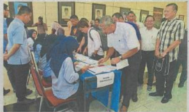
Some of the recipients lining up to collect their cheques.

The recipients include schools, resident groups, NGOs and universities.