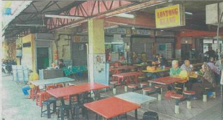
Regular patrons at Emporium Makan having their lunch.