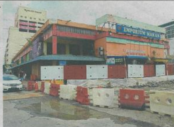
Hoardings have been put up outside Emporium Makan in anticipation of the demolition.